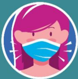
Pakai pelitup muka