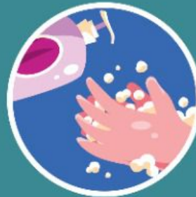
Sentiasa amalkan kebersihan diri