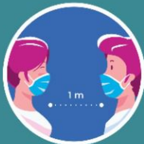
Jaga jarak fizikal dengan kawan-kawan