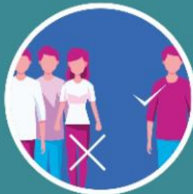
Hindari tempat sesak, jangan kumpul beramai-ramai